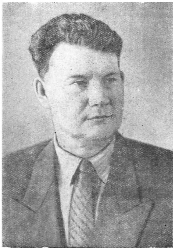
А. П. Окладников